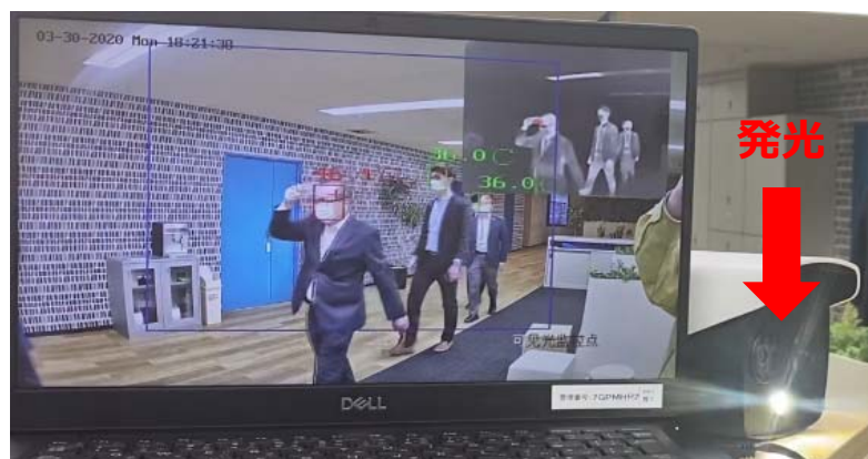
歩きながらの測温